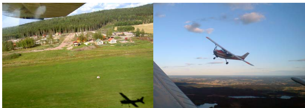
SE-FZS sedd ur två perspektiv dels innefrån och dels framifrån